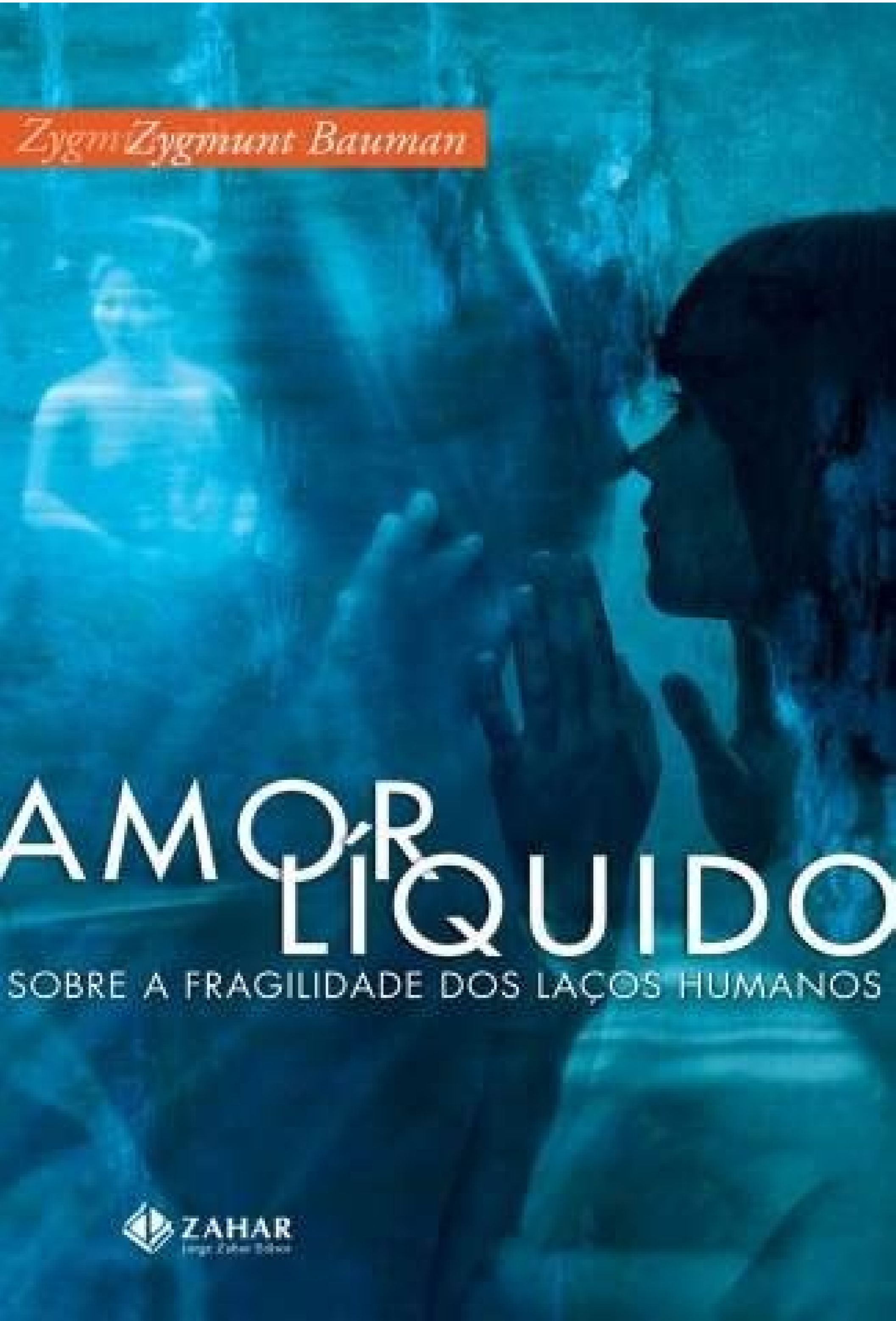
Resumo do livro amor liquido de bauman.